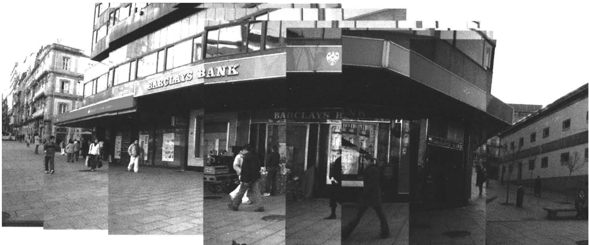
Round trip, 2005-2006.