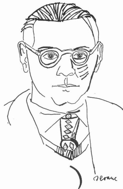
Autorretrato de Luis Seoane, do ano 1952.

Luis Seoane é, sen dúbida, o verdadeiro bardo da epopeia da emigración galega. El construíu desde a diáspora,