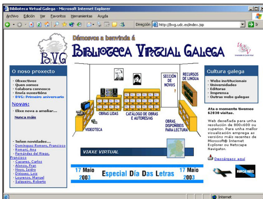
Figura 1. Páxina principal da Biblioteca Virtual Galega

A páxina principal da Biblioteca pódese ver na Figura 1. Nela aparecen as seccións de que estabamos a falar e os servizos que ofrece 3 . A seguir, procederemos a describer brevemente os contidos e o funcionamento do apartado da BVG en que imos centrar a nosa atención de cara ao traballo que nos ocupa e que non é outro que o seu catálogo.