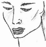
Deseño de Chelo