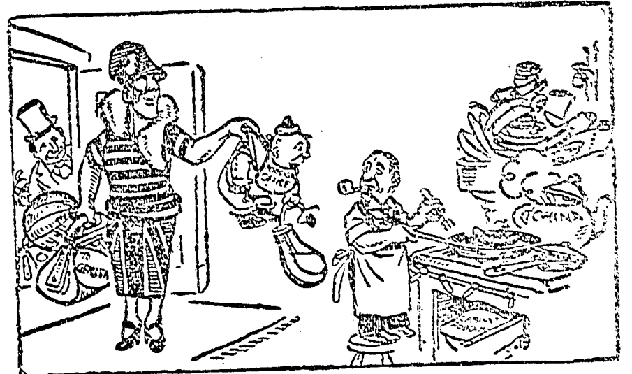
ANTES DE SALIR PARA GINEBRA

AUSTENIA:—Voy a tomar parte en el match de la Sociedad de Naciones. Así os dejo el bebé.