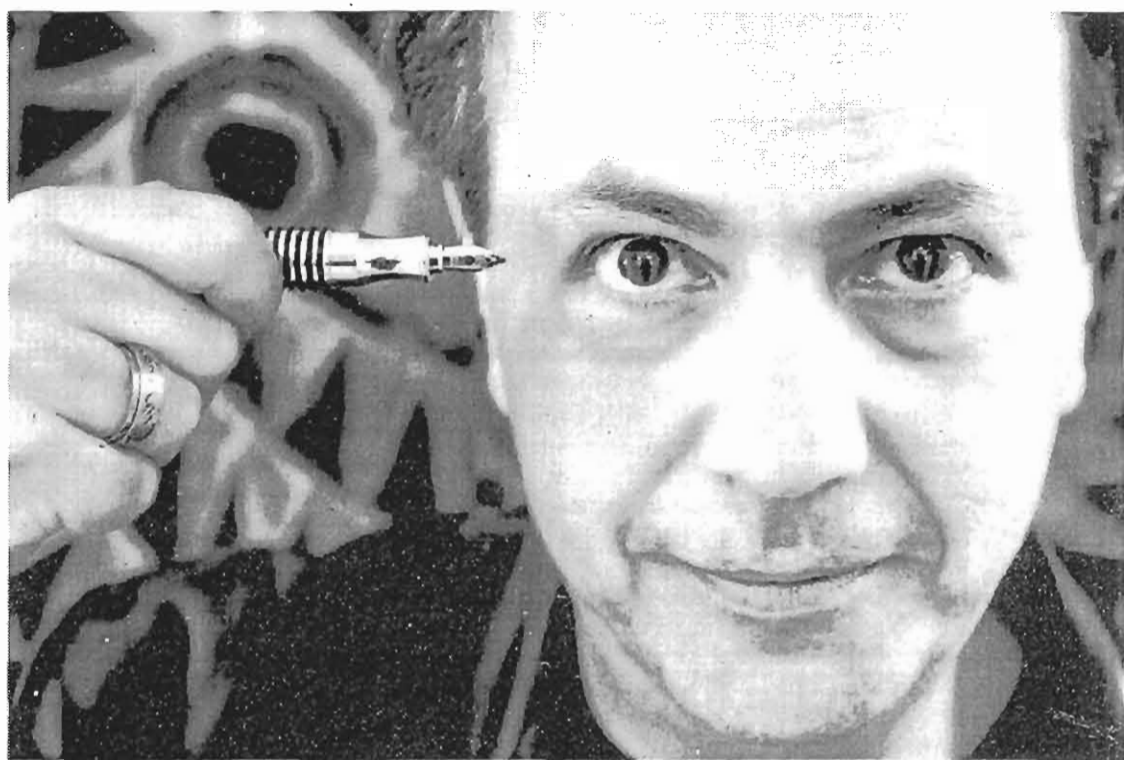
O autor viviu en Venezuela e Madrid ata instalarse na Coruña no ano 1999